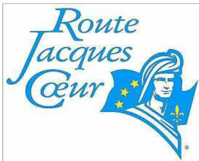
La Route Jacques-Cœur t'offre deux places pour visiter un château du Cher.

Tu as moins de 14 ans ? Lâche ton cahier de vacances, ouvre ta trousse et sors les crayons de couleurs ou utilise de la peinture. Nous te proposons de dessiner tes vacances sur une page blanche, format A4 (21 x 29,7 cm), une façon de raconter une journée à la piscine, un moment au bord de la mer, une sortie en montagne, une balade en forêt. Si ton dessin est publié,