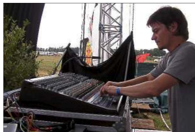
Pour cet événement, une quarantaine d'artistes venus des quatre coins du monde se déplaceront pour faire chauffer les platines. Au programme : house, dub, trance, techno...

Côté sécurité, l'association a tout prévu : le site n'étant traditionnellement accessible que par une seule route, une deuxième issue de secours, en cas d'intervention par les pompiers, a été spécialement aménagée. Quant aux risques de désagréments pour les riverains lors du festival, ils ont été réduits au maximum : « Une fois entrés, les festivaliers ne pourront plus sortir du site sans le quitter définitivement », prend en exemple Mathieu Delepau, directeur artistique. A l'extérieur du site, des rondes impliquant policiers et gendarmes seront organisées. Le niveau sonore de la musique sera également contrôlé, pour ne pas dépasser le volume de décibels réglementaire.