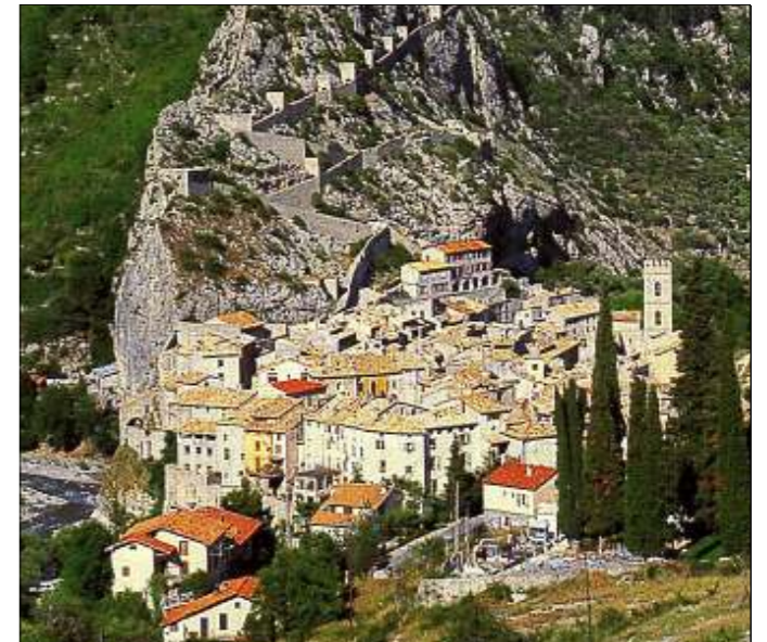
Une randonnée de quelques jours en deux-roues au cœur des gorges du Cians et de Daluis : c'est également là que le premier magistrat berruyer est allé se ressourcer.

La plume, peu de personnalités du département du Cher auront prise, cet été, pour adresser à La Nouvelle République, et donc à vous, lecteurs, un petit coucou de leur bout du monde.