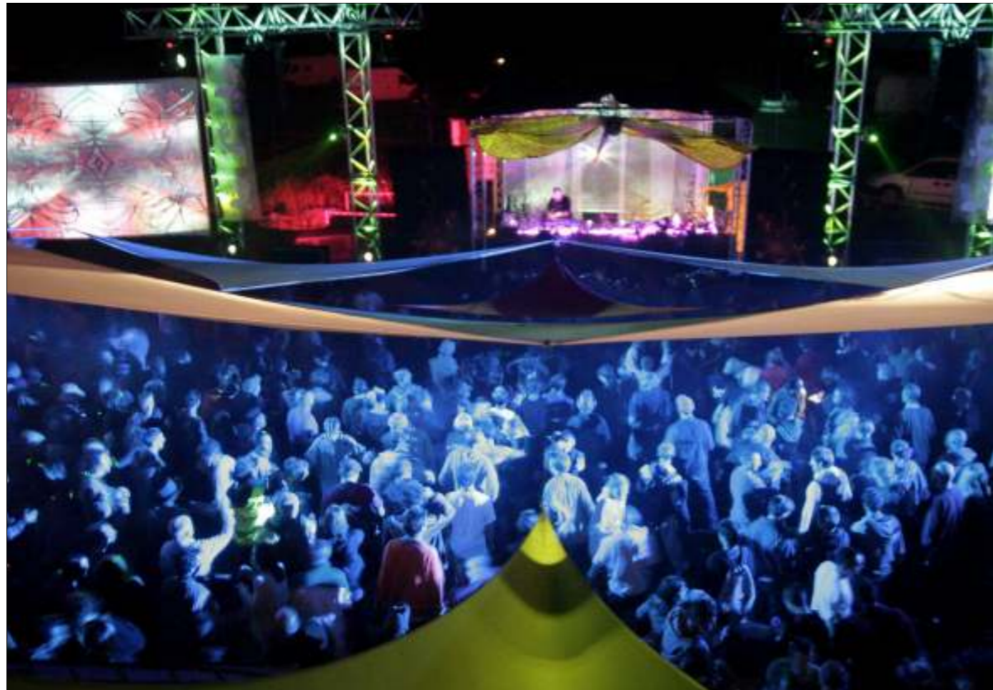
Parmi les intervenants, des DJ's bien sûr, mais aussi des associations venues spécialement pour la décoration des lieux. Deux scènes de programmation musicale et un grand dance-floor seront présents. A noter aussi : écrans géants, troupes théâtrales, conférences sur l'environnement, espaces de relaxation, stands d'artisans locaux...

Du 29 au 31 août, le festival électro Arcadia sera organisé à la Couturerie, sur la commune de Saint-Laurent. Une première qui promet.